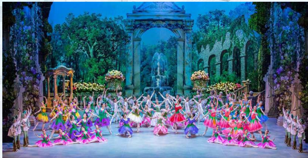
Балет «Роман бутона розы и мотылька»